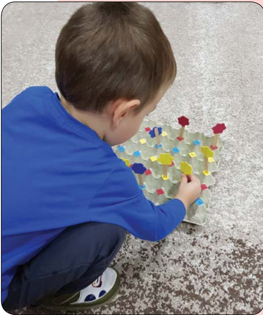
Színek és virágok – 2021. szeptember 24.