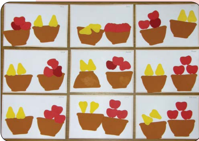
Őszi gyümölcsök – 2021. október 15