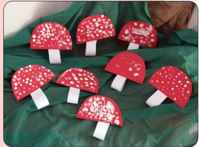
Őszi időjárás / gombák – 2021. szeptember 30